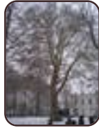
Oosterse plataan St.- Lambrechts - Woluwe Eigendom Voot Vootstraat, 67