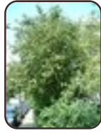
Kweepeer St.- Lambrechts - Woluwe Ideaallaan, 9