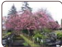
Japanse sierkers St.- Lambrechts - Woluwe Laatste-Rustlaan