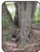
Beuk St.- Lambrechts - Woluwe Bronnenpark