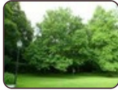
Magnolia acuminata St.- Lambrechts - Woluwe Maloupark