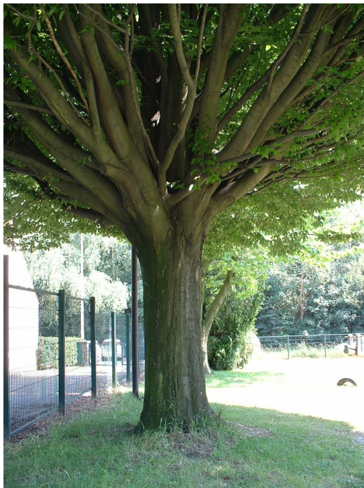
Carpinus betulus f. fastigiata ,