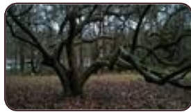
Beverboom St.- Lambrechts - Woluwe Lindekmalemole n en omgevingen Jean-François Debeckerlaan, 48