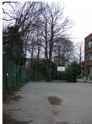
Beuk, Voormalig landgoed Lindthout